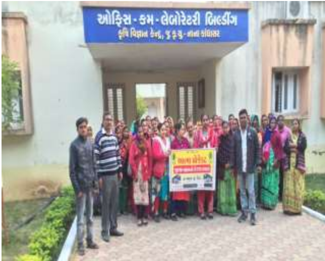
આત્મા પ્રોજેક્ટ ખેડા (પ્રેરણા પ્રવાસ)