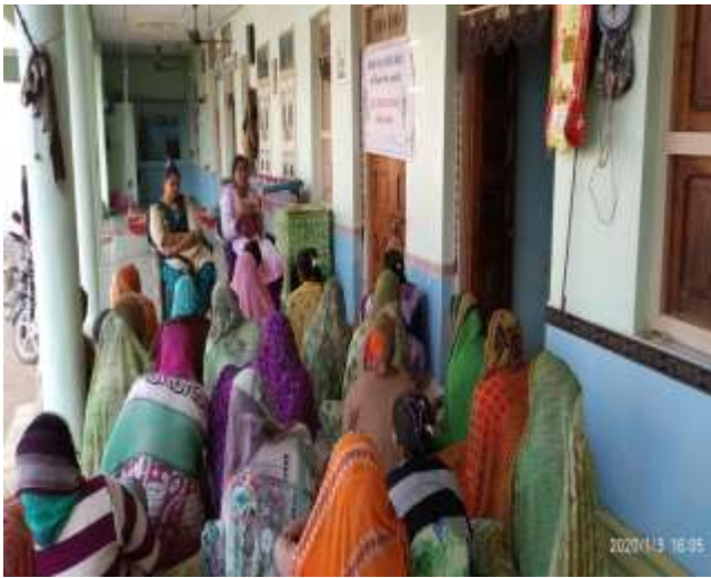
એનએફએસએમ અને નિકરા પ્રોજેક્ટ અંતર્ગત કઠોળ પાકોમાં જીવાત નિયંત્રણ વિષય પર ઓફ કેમ્પસ તાલીમ કાર્યક્રમ