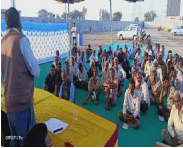
ફર્ટીલાઇઝર્સ અને કેમિકલ્સનો યોગ્ય ઉપયોગ (ખેડૂત શિબિર)