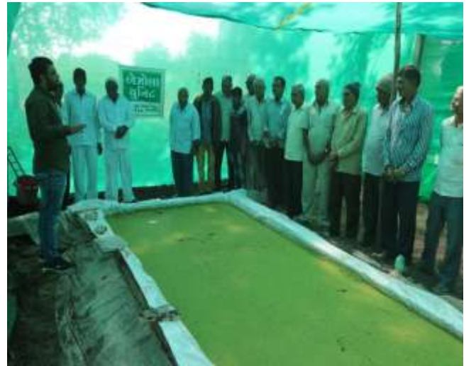
ખેડૂતોની એએલા યુનિટની મુલાકાત