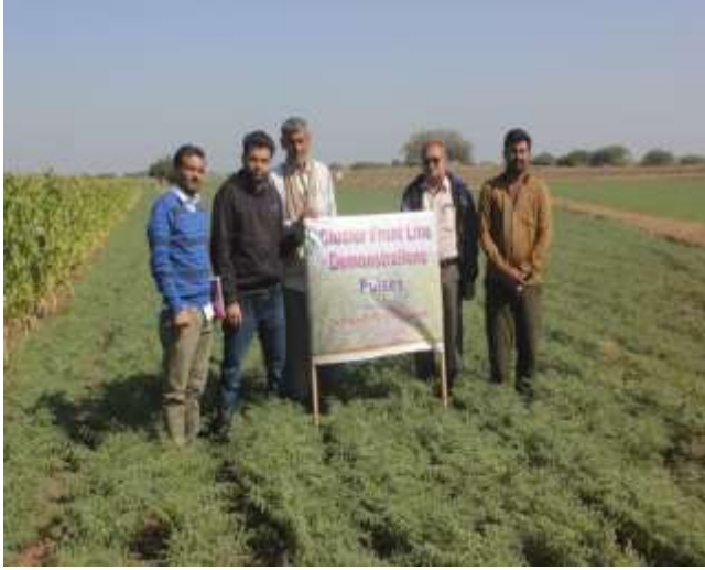
ખેડૂતોના ખેતરની મુલાકાત આપેલ CFLD