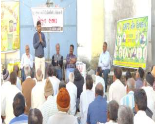
જી.કરું.યુ. અને જી.એન.એફ.સી., જૂનાગઢના સંયુક્ત ઉપક્રમે ખેડૂત સભા (ગામ: કેવદ્રા)