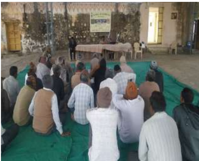
મગફળીના પાક પર બાયો-ફર્ટીલાઇઝરનો યોગ્ય ઉપયોગ (ફાર્મર્સ ફિલ્ડ સ્કુલ)