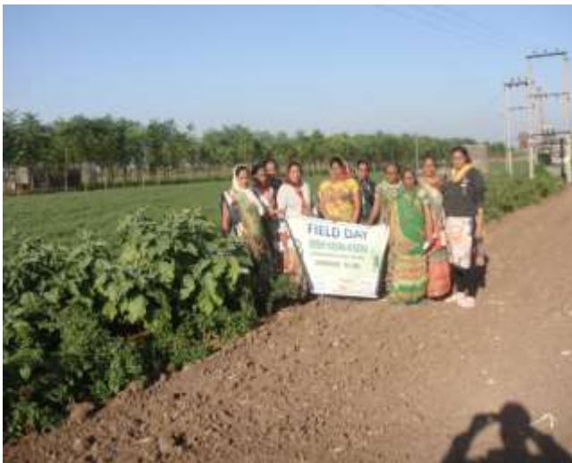
ફિલ્ડ ગાર્ડનીંગ પર ક્ષેત્રિય દિવસ