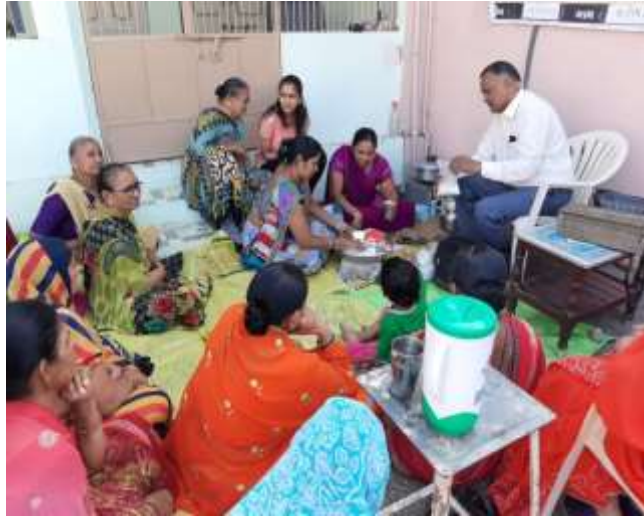
ગામ: સંરભડા, જી. અમરેલીના બહેનોને બેકરી વાનગીઓનું નિદર્શનનો ઓફ કેમ્પસ કાર્યક્રમ