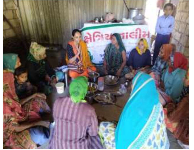
આંબળાનું મુલ્ય વૃદ્ધિ વિષય પર ઓફ કેમ્પસ તાલીમ કાર્યક્રમ