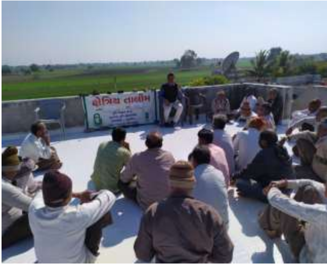
ખેતીમાં પ્લાસ્ટીકનો ઉપયોગ વિષય પર ઓફ કેમ્પસ તાલીમ કાર્યક્રમ