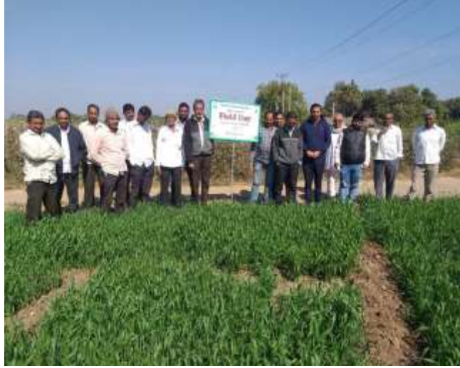
ઘઉંના પાકમાં ફિલ્ડ ડે