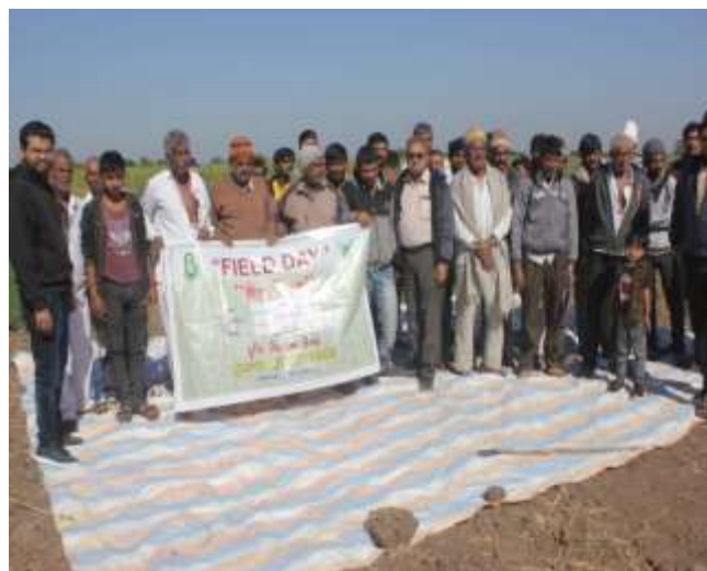
ચણાના પાકમાં ફિલ્ડ ડે