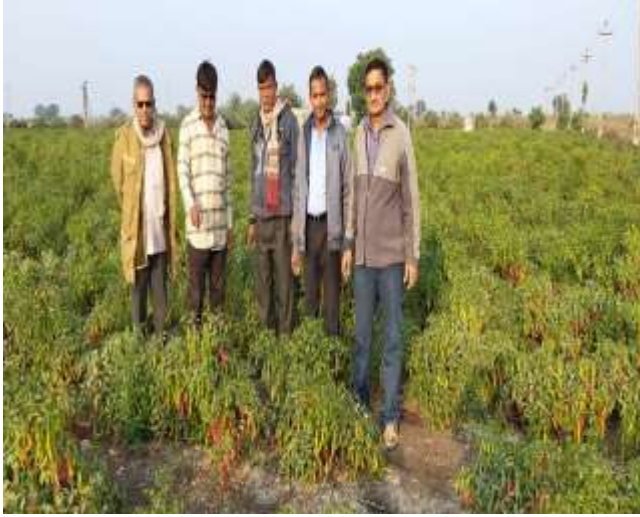
મરચાના પાકમાં વૈજ્ઞાનિકોની ક્ષેત્ર મુલાકાત