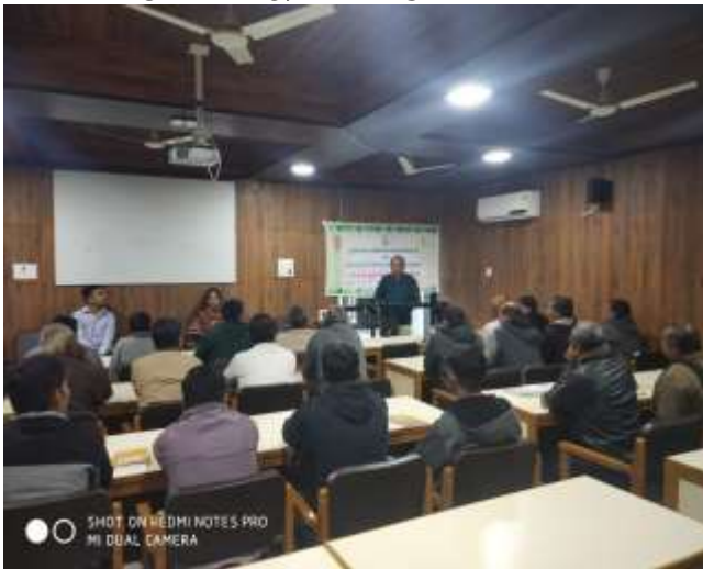
કૃષિ અને પશુ પાલન અંગેની આધુનિક વૈજ્ઞાનિક સમજ વિષય પર ઓન કેમ્પસ તાલીમ કાર્યક્રમ