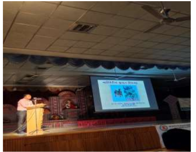
નાળીયેરીમાં જીવાત નિયંત્રણ (વૈજ્ઞાનિકનું વ્યાખ્યાન)