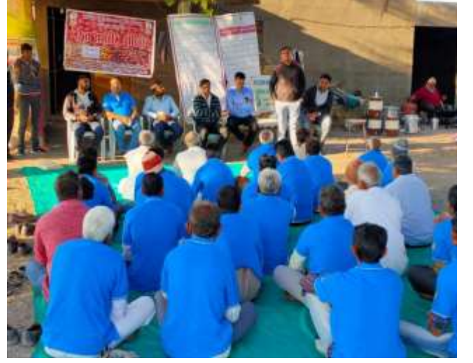
રોગ અને જીવાતોનું જૈવિક નિયંત્રણ વિષય પર ઓફ કેમ્પસ તાલીમ કાર્યક્રમ