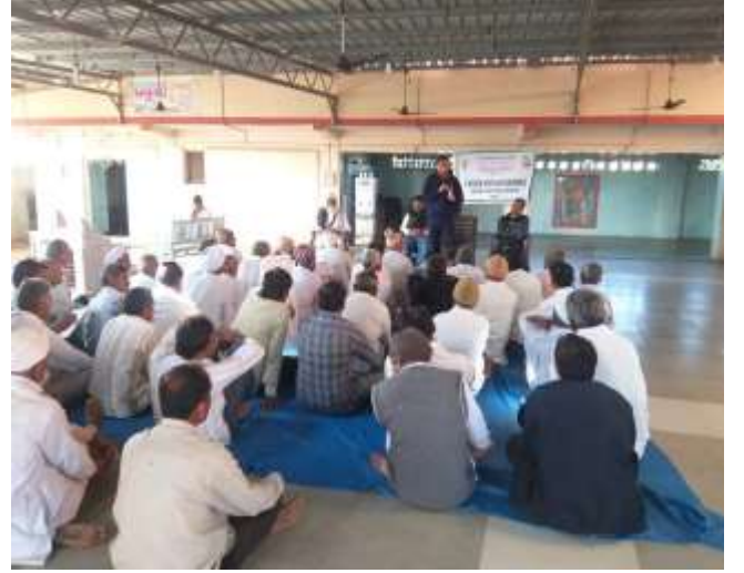
ચણામાં જીવાત નિયંત્રણ વિષય પર ઓફ કેમ્પસ તાલીમ કાર્યક્રમ