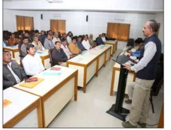
ગ્રીનહાઉસ અને નેટહાઉસ તાલીમ કાર્યક્રમ