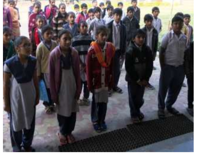
બધારણ દિવસની ઉજવણી