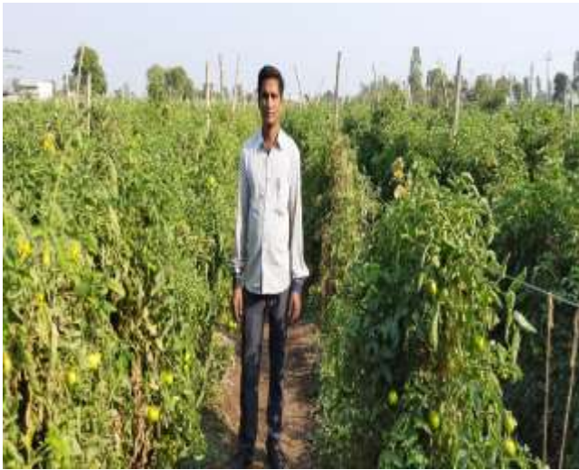
ટમેટાના પાકમાં વૈજ્ઞાનિકોની ક્ષેત્ર મુલાકાત