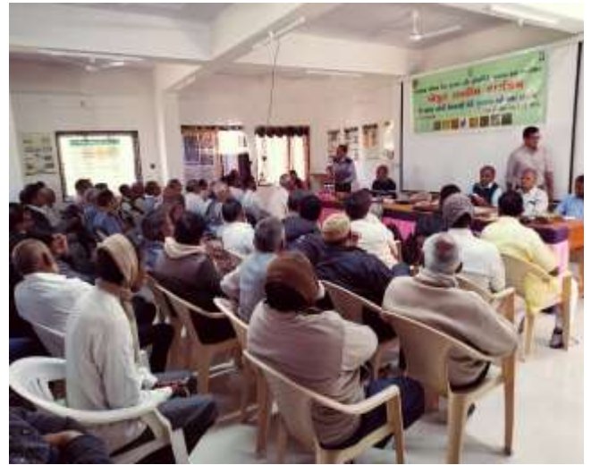
બીજ મસાલા પાકોનું મુલ્યવર્ધન અને બજાર વ્યવસ્થા નિકાસ લક્ષી ખેતી (સેમીનાર)