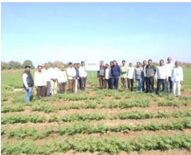
એનએફએસએમ અંતર્ગત ચણાના પાકમાં ફિલ્ડ ડે