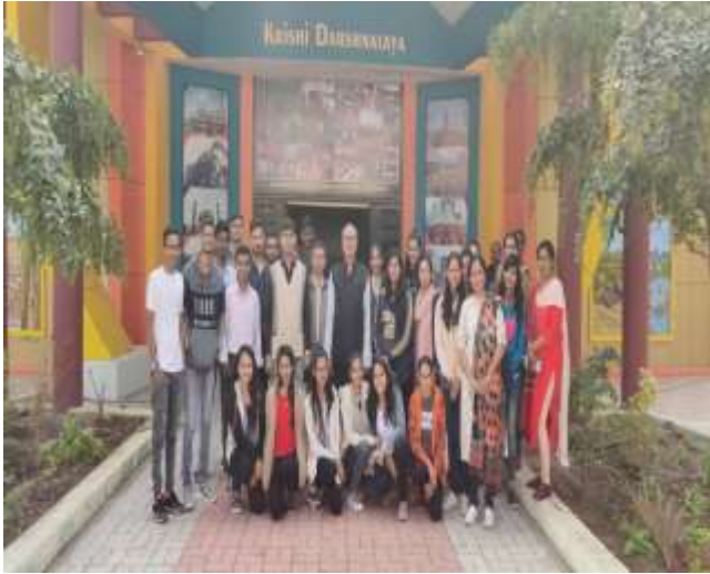
કૃષિ દર્શનાલયની મુલાકાત લેતા વિદ્યાર્થીઓ