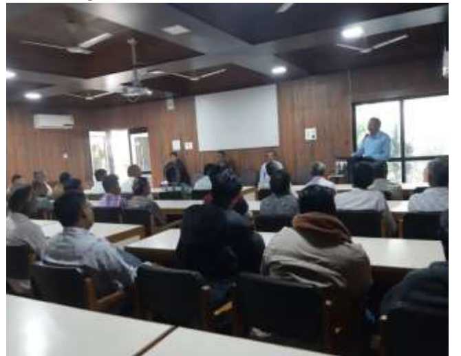
પાકોની આધુનિક વૈજ્ઞાનિક ખેતી પદ્ધતિ અંગે ઓન કેમ્પસ તાલીમ કાર્યક્રમ