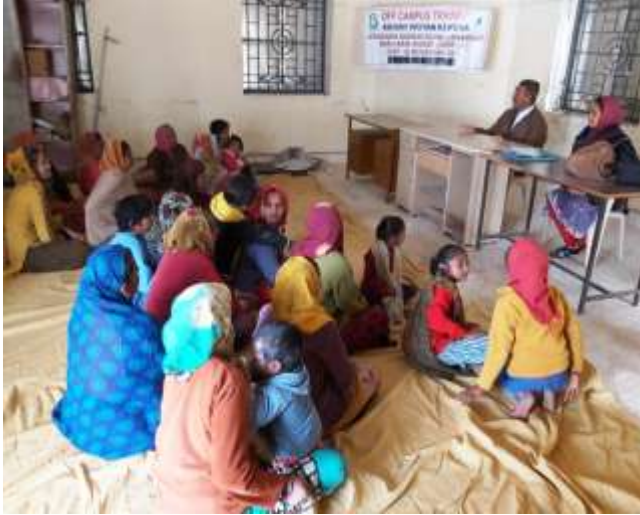
જીરું તથા ચણાના પાકમાં રોગ-જીવાત નિયંત્રણ વિષય પર ઓફ કેમ્પસ તાલીમ કાર્યક્રમ