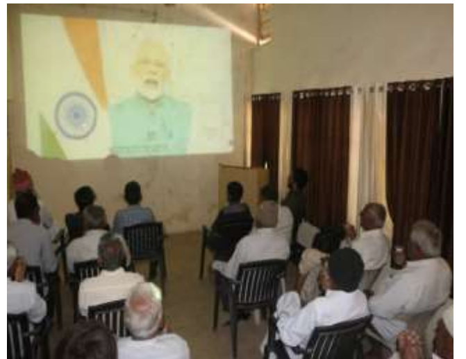
પોટેટો કોન્કલેવ અને પશુ આહાર માં ખાણદાણ નું મહત્વ વિષય પર ઓન કેમ્પસ તાલીમ કાર્યક્રમ