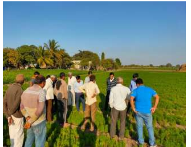
શિયાળુ પાકોમાં આવતા રોગ અને જીવાતના પ્રશ્નો (ચર્ચા સભા)