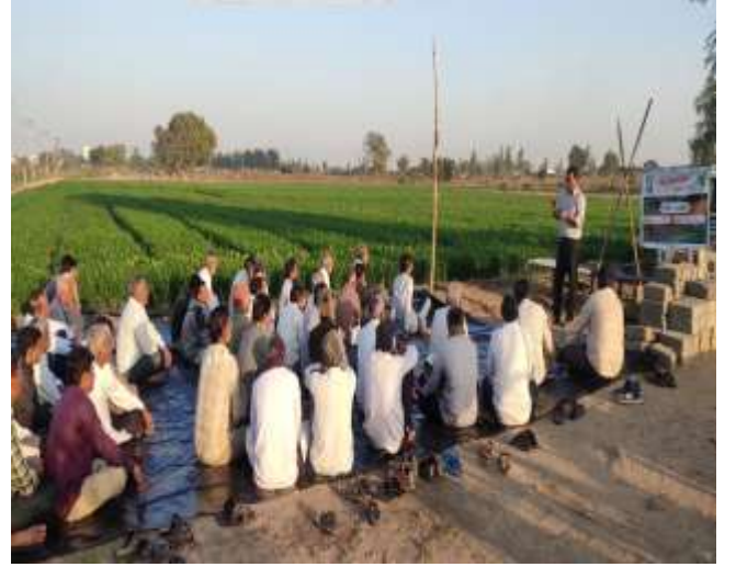
જંતુનાશકનો યોગ્ય સંગ્રહ વિષય પર ઓફ કેમ્પસ તાલીમ કાર્યક્રમ