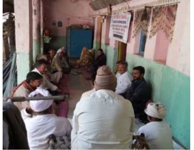
જીરું તથા ચણાના પાકમાં રોગ-જીવાત નિયંત્રણ વિષય પર ઓફ કેમ્પસ તાલીમ કાર્યક્રમ