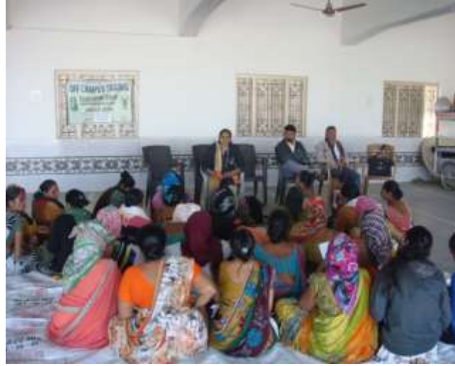
ખેડૂતોની આવક બમણી કરવા માટે તેમજ મહિલાઓની આવક વધારવા માટેની વિવિધ પ્રવૃત્તિઓ પર ઓફ કેમ્પસ તાલીમ કાર્યક્રમ