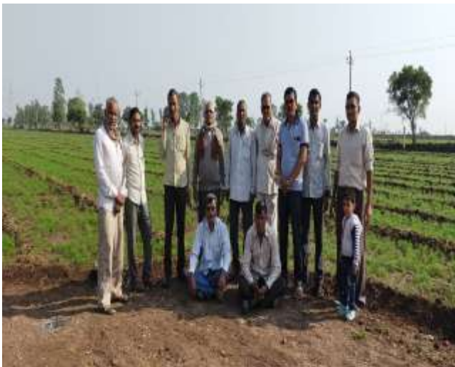
જંતુનાશકનો યોગ્ય ઉપયોગ (ફિલ્ડ ડે)