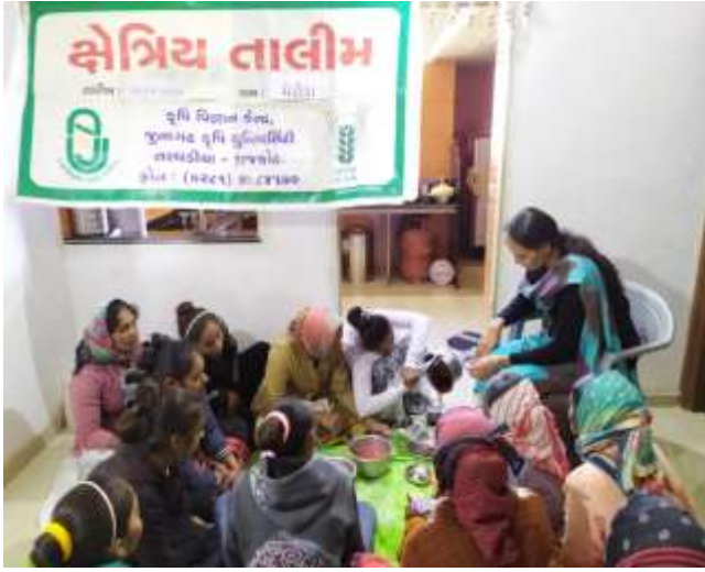
ફળ અને શાકભાજી ની સાચવણી અને વિવિધ બનાવટો વિષય પર ઓફ કેમ્પસ તાલીમ કાર્યક્રમ