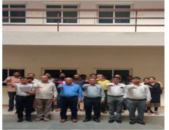
વિશ્વ મતદાતા દિવસ નિમિત્તે વિસ્તરણ શિક્ષણ નિયામકશ્રીની કચેરીના અધિકારીશ્રીઓ તથા કર્મચારીશ્રીઓ દ્વારા સપથ લેવામાં આવી