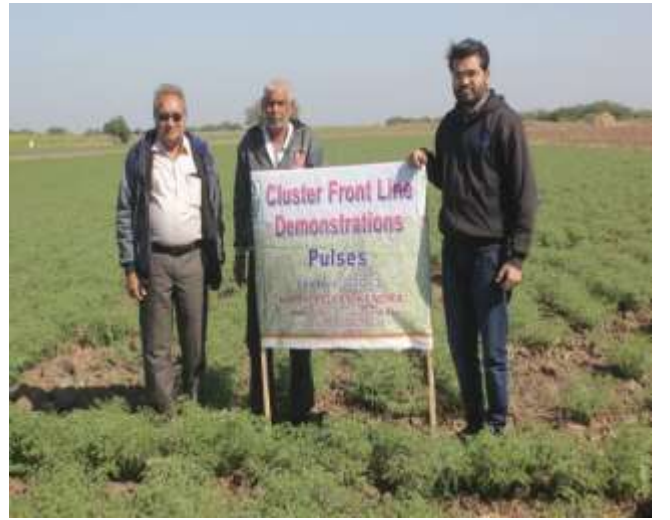
આપેલ ખેડૂતોના ખેતરની મુલાકાત CFLD