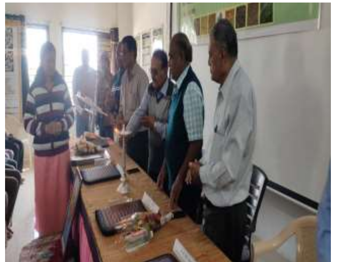
બીજ મસાલા પાકોનું મુલ્યવર્ધન અને બજાર વ્યવસ્થા નિકાસ લક્ષી ખેતી (સેમીનાર)