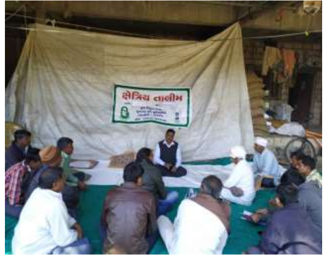
બિનપરંપરાગત ઉર્જા નું ખેતીમાં મહત્વ અને તેનો ઉપયોગ વિષય પર ઓફ કેમ્પસ તાલીમ કાર્યક્રમ