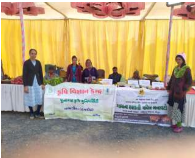
કૃષિ પ્રદર્શનમાં હાજરી