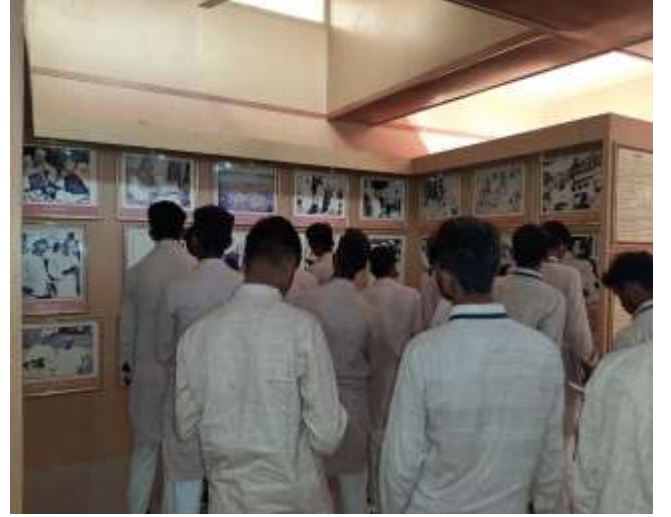
બી.આર.એસ., શારદાગ્રામ (પ્રેરણા પ્રવાસ)