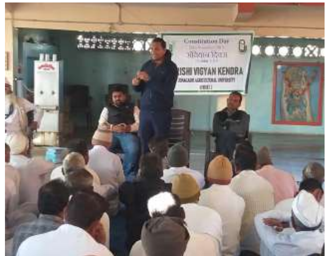
ખેતીમાં પ્લાસ્ટિકનો ઉપયોગ વિષય પર ઓફ કેમ્પસ તાલીમ કાર્યક્રમ