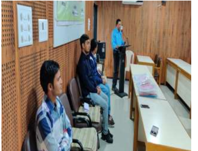
સેન્ટર ઓફ કોમ્યુનિકેશન યોજના અંતર્ગત ઓન કેમ્પસ ખેડૂત તાલીમ કાર્યક્રમ (ગામ. માળિયા હાટીના)