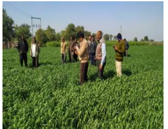
વૈજ્ઞાનિકોની ક્ષેત્ર મુલાકાત