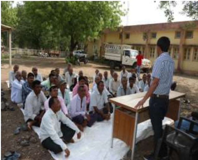
મસાલા પાકોમાં રોગ જીવાત નિયંત્રણ પર ઓન કેમ્પસ તાલીમ કાર્યક્રમ