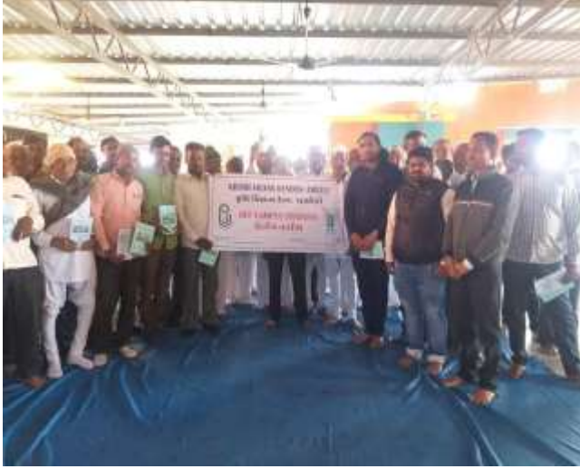
ઉદ્યોગ સાહસિકતાનો વિકાસ વિષય પર ઓફ કેમ્પસ તાલીમ કાર્યક્રમ