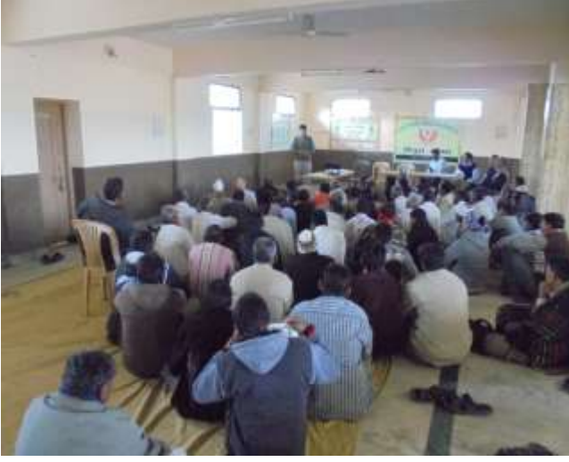
શિયાળુ પાકોમાં રોગ અને જીવાતોનું નિયંત્રણ વિષય પર ઓફ કેમ્પસ તાલીમ કાર્યક્રમ