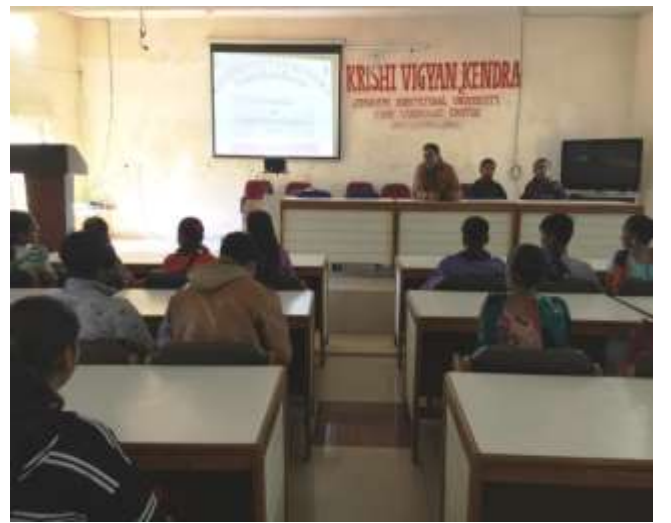
ગ્લોબલ પોટેટો કોન્ફરન્સ - ૨૦૨૦