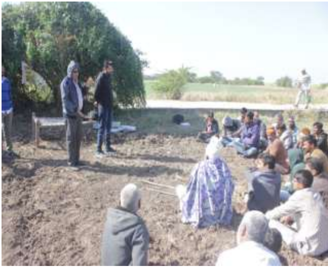
મુખ્ય પાકોમાં જીવાતનું જૈવિક નિયંત્રણ વિષય પર ઓફ કેમ્પસ તાલીમ કાર્યક્રમ