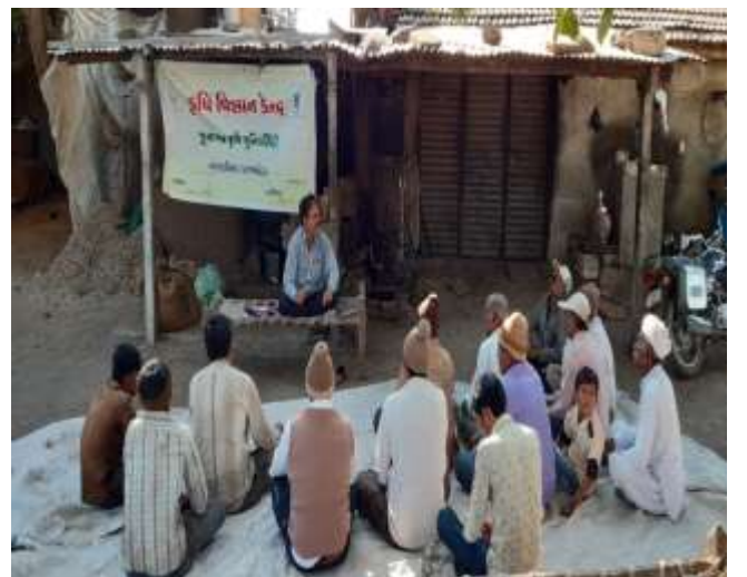
સંવિધાન દિવસની ઉજવણી