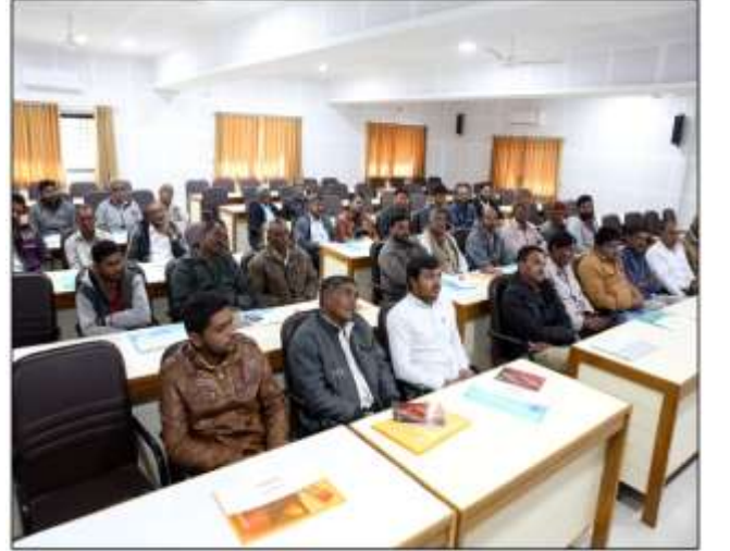
ગ્રીનહાઉસ અને નેટહાઉસ તાલીમ કાર્યક્રમ