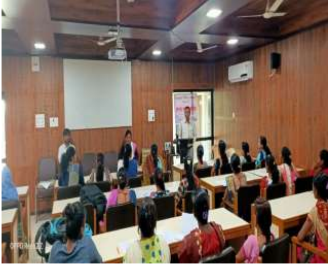
ખેડૂત તાલીમ કેન્દ્ર - વ્યારા (પ્રેરણા પ્રવાસ)