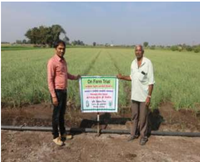
લસણના પાકમાં ઓ.એફ.ટી.ની મુલાકાત