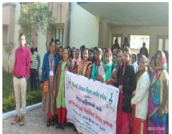
ખેડૂત તાલીમ કેન્દ્ર, નર્મદા (પ્રેરણા પ્રવાસ)