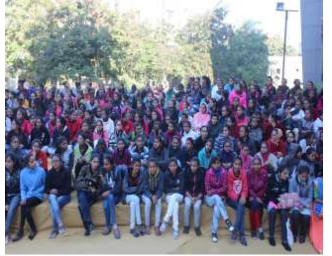
સંવિધાન દિવસની ઉજવણી