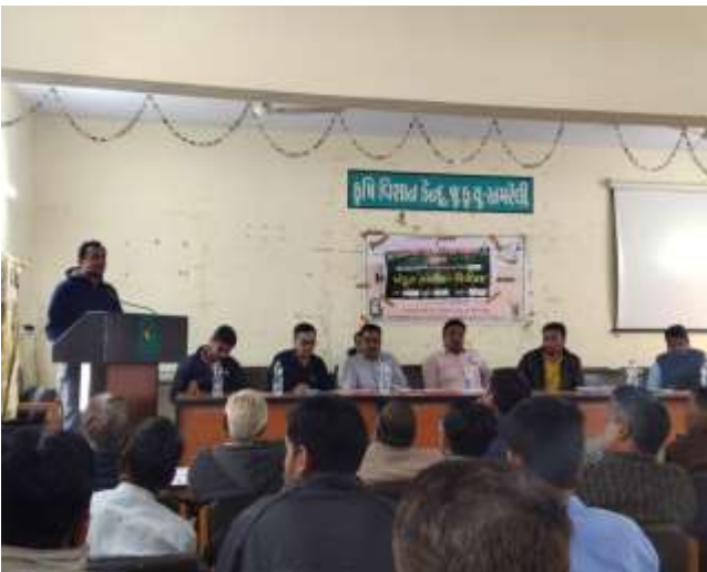
શિયાળુ પાકોમાં સંતુલિત પોષણ વ્યવસ્થાપન વિષય પર ઓન કેમ્પસ તાલીમ કાર્યક્રમ